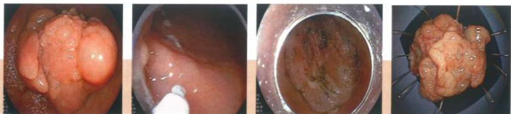
胃体下部大弯ESD 実施症例