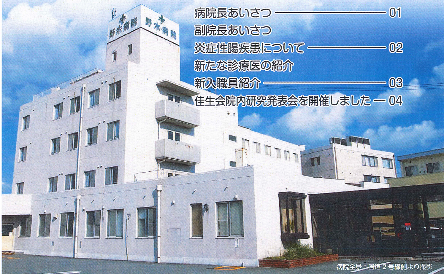
病院全景：国道2号線側より撮影