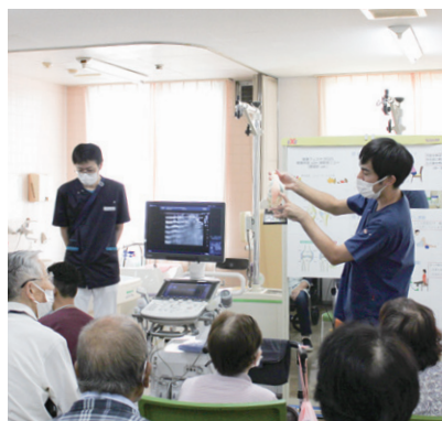
健康体操 with エコー