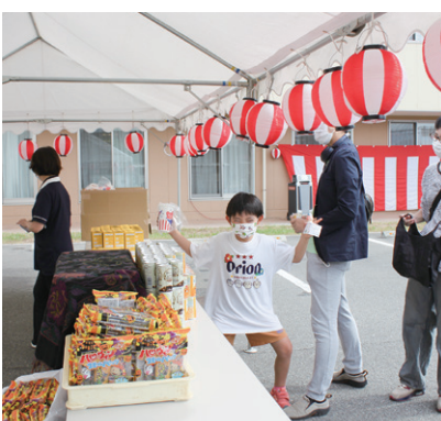
スタンプラリーで防災ボトルゲット