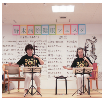
ニコニコナースによる二胡の演奏