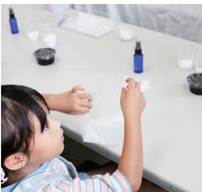
どの香りにしようかな バスボム作り