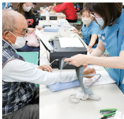
血管年齢 ドキドキ！