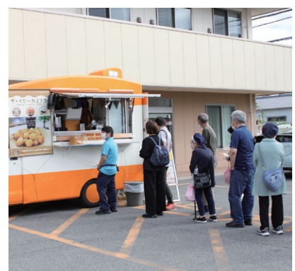
ベビーカステラおいしかった！