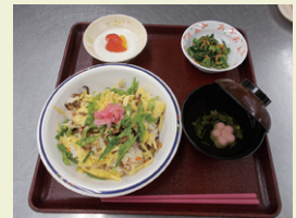
ひな祭り献立 ちらし寿司

昨年5月から、ミャンマーから2名の女性が調理スタッフとして一緒に働いています。暖かいお国の2人にとって、日本の冬は寒いので心配をしていましたが、彼女たちは、バランスの良い食事、肉・魚・豆腐・卵・野菜・果物と、唐辛子、ニンニクを使って調理をして3食食べて、寒い冬を乗り越えて頑張っています。健康は、バランスのとれた食事が大切だと、彼女たちからも教えてもらいました。栄養科スタッフも、自分の身体にも気をつけて、これからもみんなで協力し精進していきたいと思ひます。