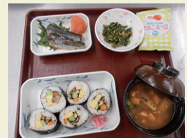
節分献立 巻き寿司